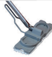
Multi Mop (mit Auswringmechanik) für die Nassreinigung