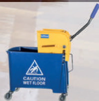
Eimer mit Auswingvorrichtung