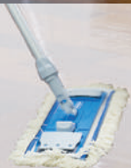
Multi Mop II Baumwoll-Fransen