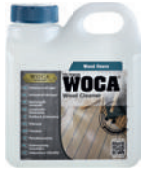
Intensivreiniger Grundreiniger für Parkett