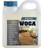
Holzbodenseife für die monatliche Reinigung/Pflege