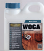
Öl-Refresher Natur / Weiss