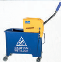
Eimer mit Auswringvorrichtung