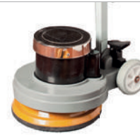
Polisher für das maschinelle Nachölen