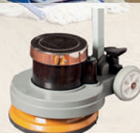
Polisher optional, für maschinelle Verarbeitung