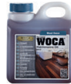
Pflegöl fürs Nachölen im Privatbereich