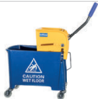
Eimer (mit Auswringmechanik) zu Multi Mop II