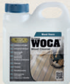
Intensivreiniger farblosler Tiefenreiniger