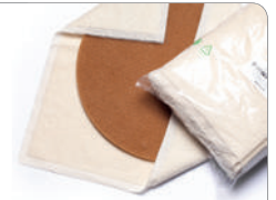
Frottéetücher für eine perfekte Endpolitur