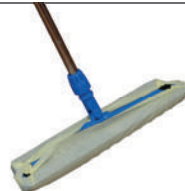
Trapezwischgerät Staubmagnet / Trockenreinigung