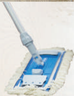
Multi Mop II Baumwoll-Fransen