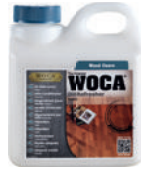
Öl-Refresher Öl-Pflegebalsam für Parkett