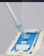
Multi Mop II Baumwoll-Fransen