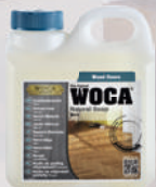
Holzbodenseife Natur / Weiss / Grau