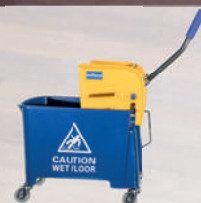
Eimer mit Auswringvorrichtung