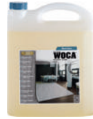
Meisterseife (Objektbereich) für die tägliche / wöchentliche Reinigung