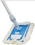
Multi Mop II für die Nassreinigung