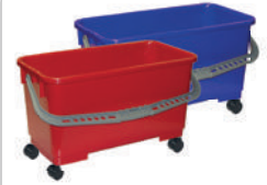
Eimer rot / blau zu Multi Mop