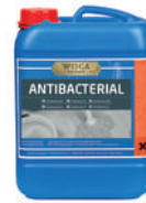
Antibakteriell (Desinfektion) entfernt Viren, Keime, Bakterien