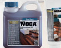
Pflegöl /-paste in vers. Farben erhältlich